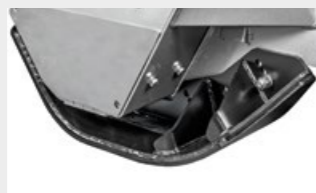
Patines especiales de penetración subterránea