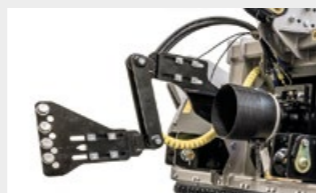
Dispositivo de autoalineamiento entre eje de toma de fuerza PTO/transmisión tipo W permite que el implemento trabaje en diversos ángulos sin dañar el PTO