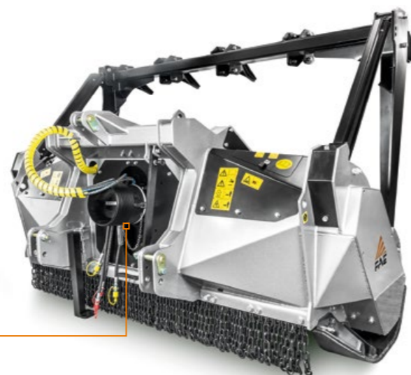
Sistema autoajustable del eje de toma de fuerza PTO/transmisión tipo Z manteniendo siempre el ángulo correcto de operación entre el eje PTO y el toma de fuerza (opcional)